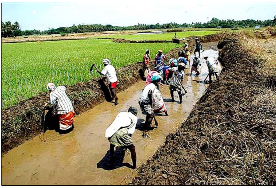
মজুরির হিসেব হওয়ার পর তা থেকে কেটে নেওয়া হবে। মজুরি দিতে প্রায়ই বিলম্ব হয় ব্যাংক, ডাক ব্যবস্থা এবং কর্মীর অপ্রতুলতায়। মন্ত্রক রাজ্য সরকারগুলিকে পাঠানো এক চিঠিতে বলেছেন, 'ব্যাংকিং ব্যবস্থা জোরদার না হওয়া পর্যন্ত, সব পঞ্চায়েতে এলাকায় ডাক ব্যবস্থা ছড়িয়ে না পড়া পর্যন্ত, একটি বিকল্প হিসেবে শ্রমিকদের আংশিক মজুরি আগাম দেওয়ার কথা বিবেচনা

নয়াদিল্লি, ৫ ডিসেম্বর : মহাত্মা গান্ধি জাতীয় গ্রামীণ কর্মসংস্থান নিশ্চয়তাকরণ প্রকল্পে নানা সমালোচনা রয়েছে। দিনদিন সমালোচনা বাড়ছে। প্রশাসনিক চিলেমি এবং দুর্নীতির অভিযোগ রয়েছে। এর পরিপ্রেক্ষিতে কেন্দ্র কতগুলি পদক্ষেপ নেওয়ার কথা ভাবছেন। তারই অঙ্গ হল এই প্রকল্পে যারা কাজ পান তাদের মজুরির আংশিক নগদে আগাম দিয়ে দেওয়ার একটি প্রস্তাব। উদ্দেশ্য এতে যারা উপকৃত হওয়ার কথা তাদের আস্থা ফিরিয়ে আনা। কেন্দ্রের গ্রামীণ বিকাশ মন্ত্রক এই প্রকল্পে বিশেষ করে যেসব জেলা বা পঞ্চায়েতে মজুরি দিতে বিলম্ব হয়েছে সেইসব এলাকায় মাসব্যাপী পাইলট প্রকল্প চালু করার নির্দেশ দিয়েছেন। এ থেকে যে অভিজ্ঞতা হবে তার ভিত্তিতে দৃঢ়ভাবে আগাম মজুরি দেওয়ার প্রকল্প তৈরি করা যাবে। মন্ত্রকের এক কর্মী বলেছেন, 'যেসব এলাকায় প্রধানত কর্মী কম থাকায় মজুরি দিতে দেরী হয়েছে সেসব এলাকায় পাইলট প্রকল্প নেওয়ার কথা বলেছি।' আগাম মজুরি পরে পূর্ণ